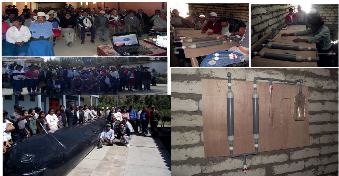
Figura 2. Instalación y capacitaciones a las comunidades altonadinas para el uso de biodigestores

se realizó el análisis de rutina de fertilidad del suelo, para determinar el contenido de nutrientes presentes en el suelo donde se instalaron las parcelas experimentales determinó el contenido de nitrógeno, fósforo, potasio, calcio, pH, conductividad eléctrica, capacidad de intercambio catiónico y aluminio intercambiable, para los bioabonos se realizó el análisis de rutina del biol y biosol, para determinar el contenido de nutrientes que aportarán al suelo, tendientes a incrementar el rendimiento en el contenido de nitrógeno, fósforo, potasio, calcio, pH y conductividad eléctrica. (Marti, 2008).