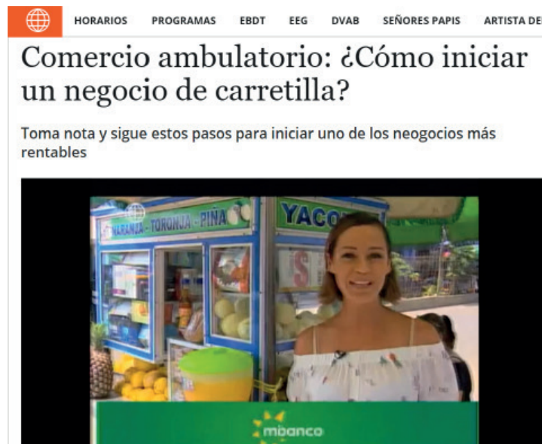
Figura 3. Comercio ambulatorio: ¿Cómo iniciar un negocio de carretilla?

El reportaje hace referencia al negocio ambulante de emoliente y comidas, pero, como se ha dicho, el mercado es muy amplio, los ambulantes venden o comercializan todo tipo de productos, y hasta los periódicos hacen referencia o alientan a las personas de como incursionar en este rubro.