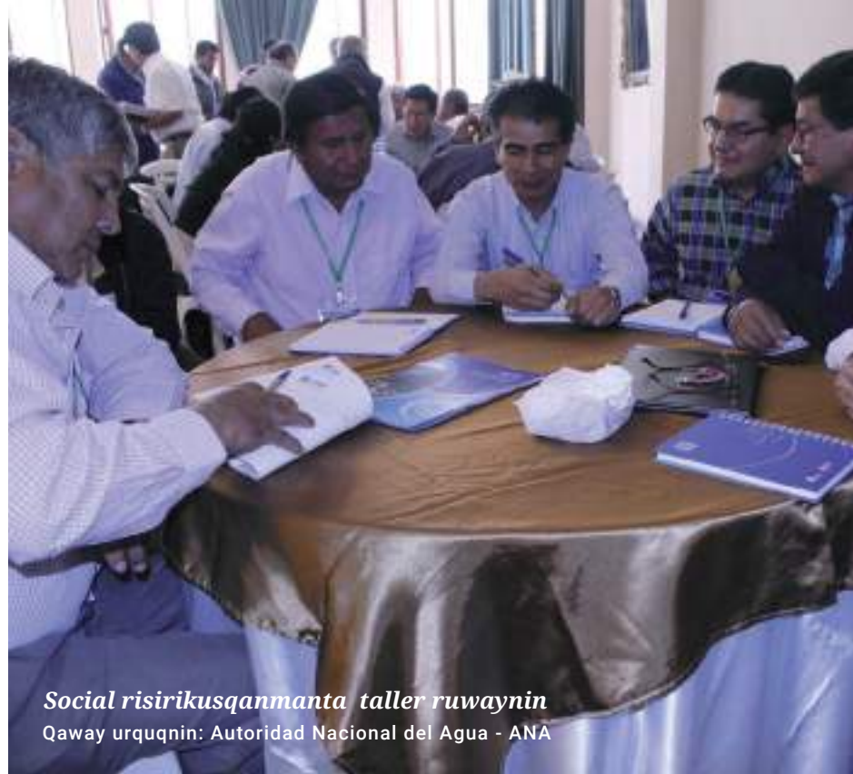
Social risirikusqanmanta taller ruwaynin Qaway urquqnin: Autoridad Nacional del Agua - ANA

Kayna kasqanpim, Gobierno paqarir-qachimun Ley de Recursos Hídricos qapaq qillqata, chaypim kamachimunku Sistema Nacional de Gestión de Recursos Hídricos wasita paqarichnankupaq, chaymanta pacha llamkanankupaq: Política Nacional del Ambiente (PNA), Política y Estrategia Nacional de Recursos Hídricos (PENRH), Plan Nacional