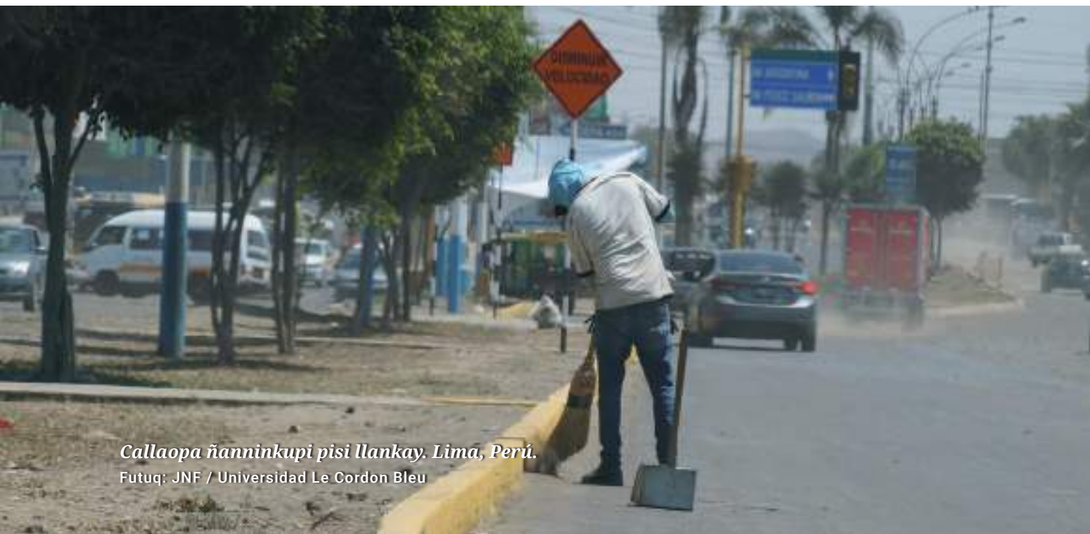
Callaopa ñanninkupi pisi llankay. Lima, Perú.

“Vivimos Kay watakuna kawsakusqanchispi, ima kaq qatiyqa cambio nisqanmi, wakinqa pasaqllan”