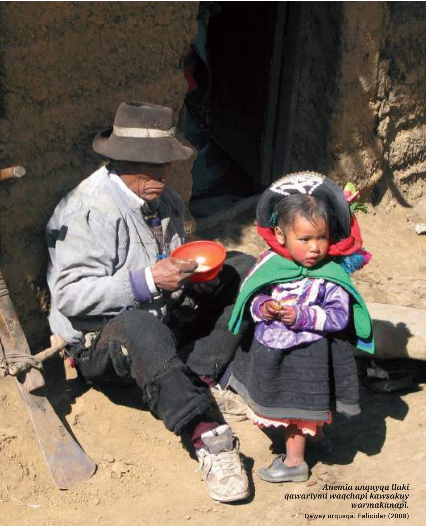
Anemia unquyqa llaki qawariymi waqchapi kawsakuy warmakunapí.