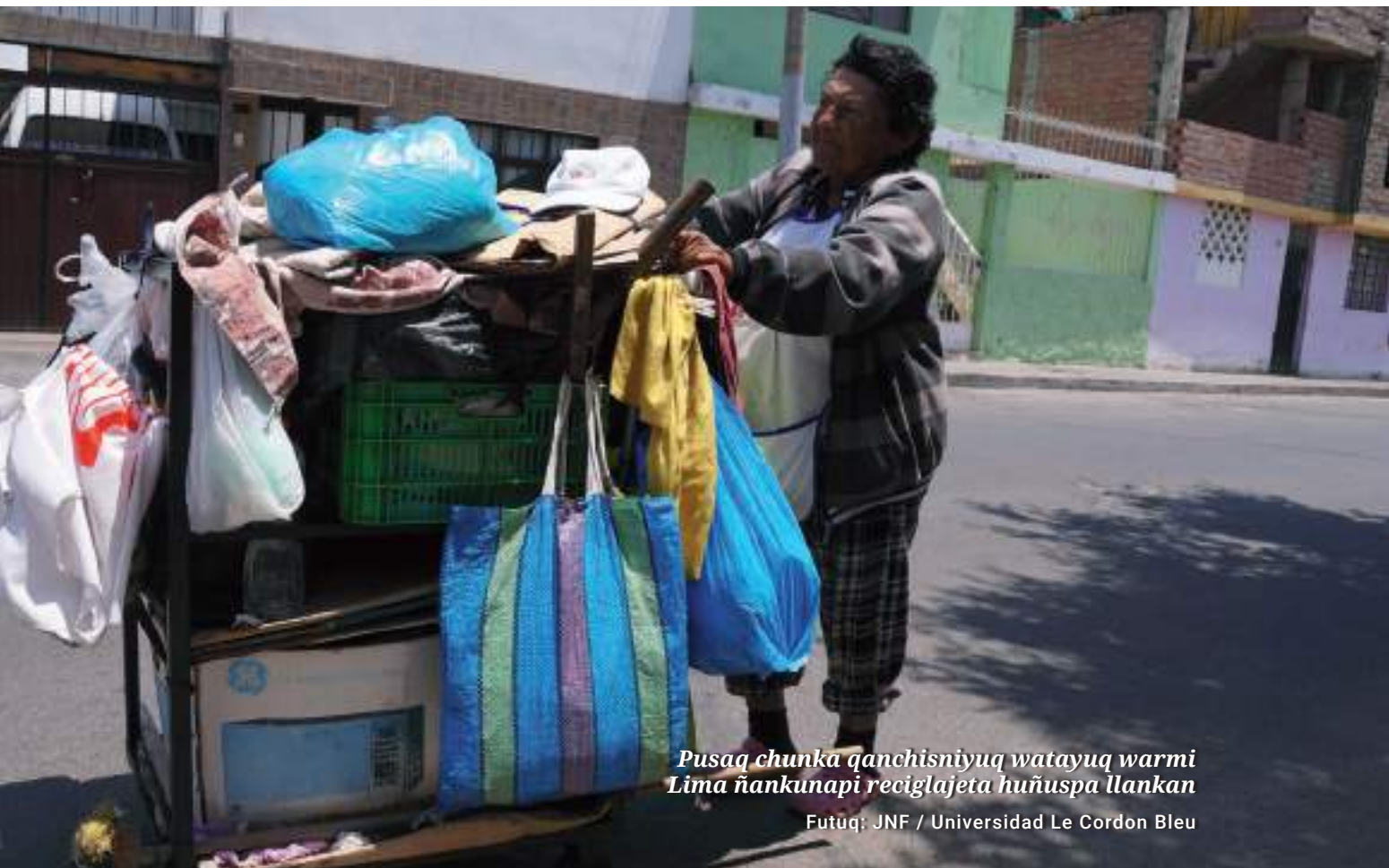
Pusaq chunka qanchisniyuq watayuq warmi Lima ñankunapi reciclaleta huñuspa llankan

“Achka sasachakuy salud publica nisqapi yanapanchis mayqinkunan mañakunku utqayman estado politicas kayninta mana astawan mirarinanpaq”