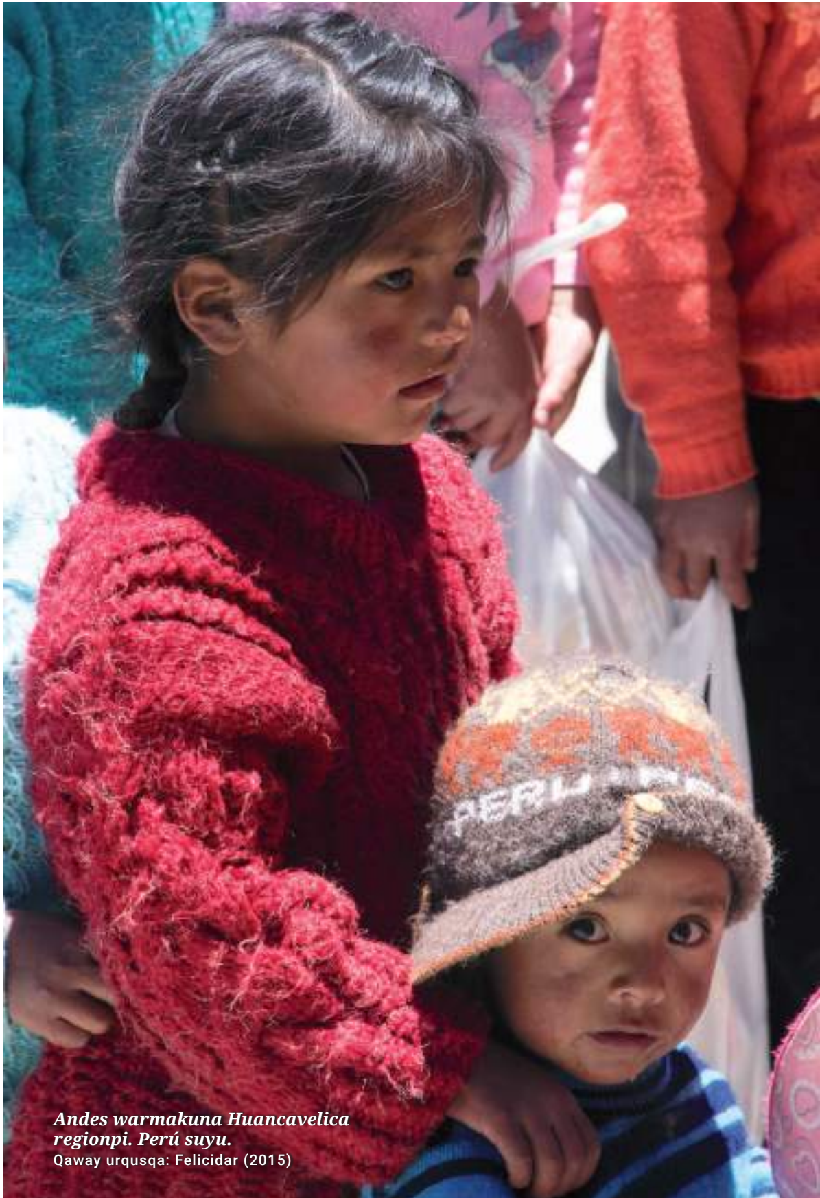
Andes warmakuna Huancavelica regionpi. Perú suyu. Qaway urqusqa: Felicidad (2015)