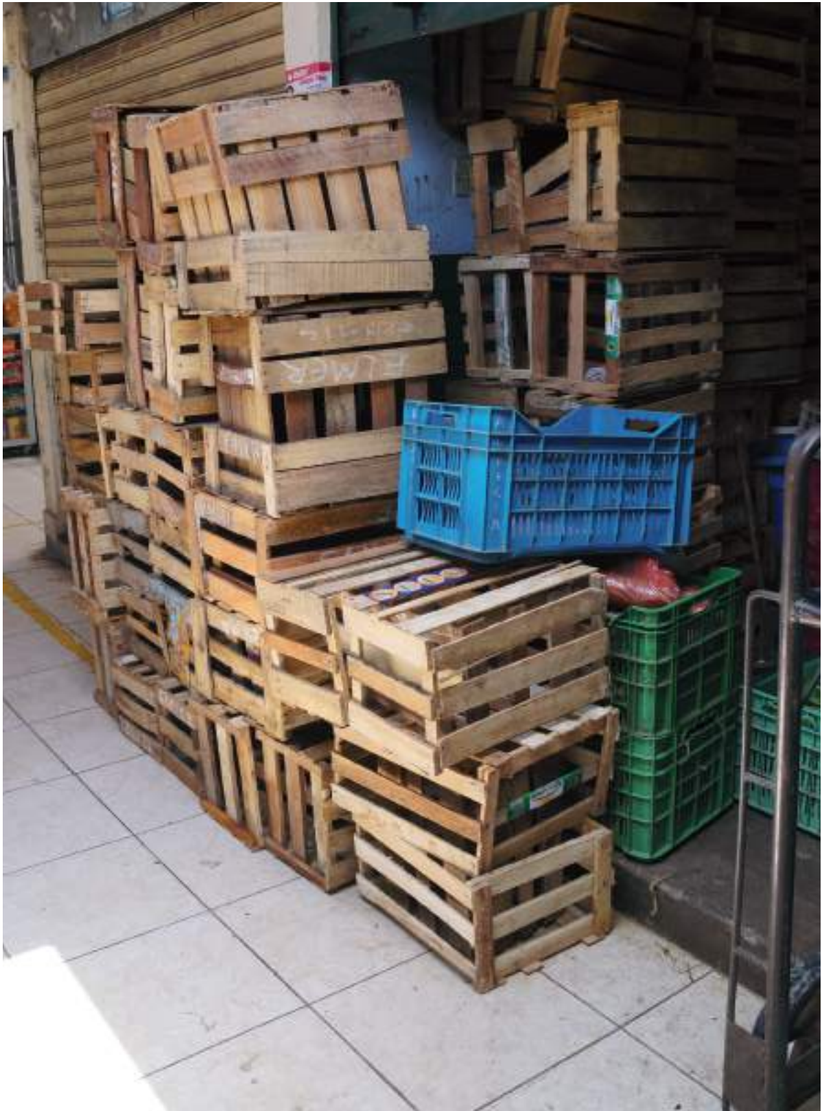
Mercado ukupi pisi kawsaykuna Futuq: JNF / Universidad Le Cordon Bleu